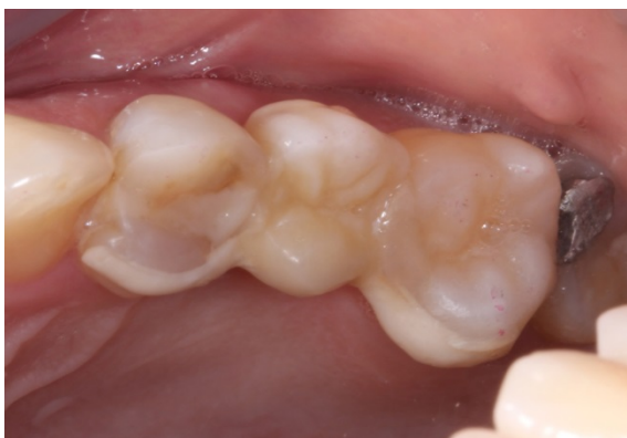
FIGURA 5 – Prótese fixa adesiva na região do elemento 25.

O caso foi acompanhado por um período de 1 ano apresentando estabilidade dos tecidos de suporte e ótima estética (FIGURAS 6 e 7).