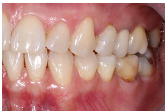
FIGURA 1 - Coroa metalocerâmica no dente 25.

Uma paciente do gênero feminino, com 55 anos de idade procurou a clínica privada para avaliação do dente 25, que apresentava dor ao mastigar, e sensação de edema no local. Após exame clínico e radiográfico, constatou-se a presença de uma coroa metalocerâmica cimentada sobre um núcleo metálico fundido e uma linha hipodensa na raiz compatível com uma trinca (FIGURAS 1 e 2) e, por isso, foi indicada a exodontia. Foi proposta a reabilitação com um implante osseointegrável, porém por motivo econômico a paciente não poderia realizar naquele momento e assim foi proposta a reabilitação com uma prótese fixa adesiva, porém a paciente não gostaria de uma prótese com metal e assim, a prótese fixa adesiva livre de metal cimentada nos dentes 24 e 26 foi a opção escolhida.