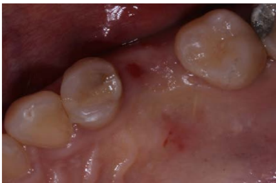
FIGURA 4 – Rebordo cicatrizado.