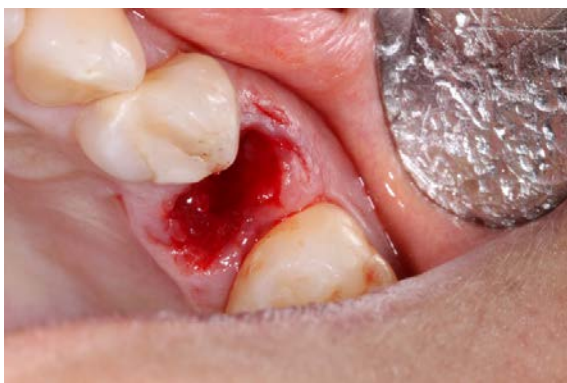
FIGURA 3 – Dente extraído.

palatina dos dentes 24 e 26 para remover pequenas retenções (FIGURA 4). Em seguida foi realizada a moldagem com silicone de adição para a confecção da prótese fixa com uma fibra de reforço e resina composta reforçada com cerâmica. Foi feito o condicionamento com ácido fosfórico e sistema adesivo nos dentes 24 e 26 e a prótese foi cimentada com cimento resinoso (FIGURA 5).