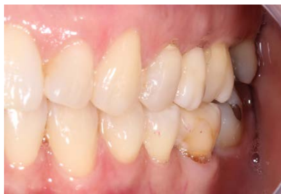
FIGURA 6 – Vista vestibular da prótese fixa adesiva.

O caso foi acompanhado por um período de 1 ano apresentando estabilidade dos tecidos de suporte e ótima estética (FIGURAS 6 e 7).