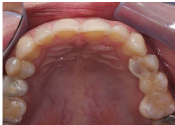
FIGURA 7 – Vista oclusal do caso finalizado.