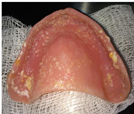
FIGURA 1 - Prótese mal higienizada de paciente internado em Unidade de Terapia Intensiva – necessidade de ações de higienização mais efetivas pela equipe interdisciplinar

estado de sedação do paciente, a presença ou não de ventilação mecânica e tipo de alimentação são fatores que influenciam diretamente a saúde oral dos pacientes internados em UTIs, podendo favorecer o acúmulo de biofilme, saburra lingual (Figura 2), problemas periodontais (gingivite, periodontite), além de infecções oportunistas na boca devido à imunossupressão e diminuição do fluxo salivar devido à ação medicamentosa 6 .